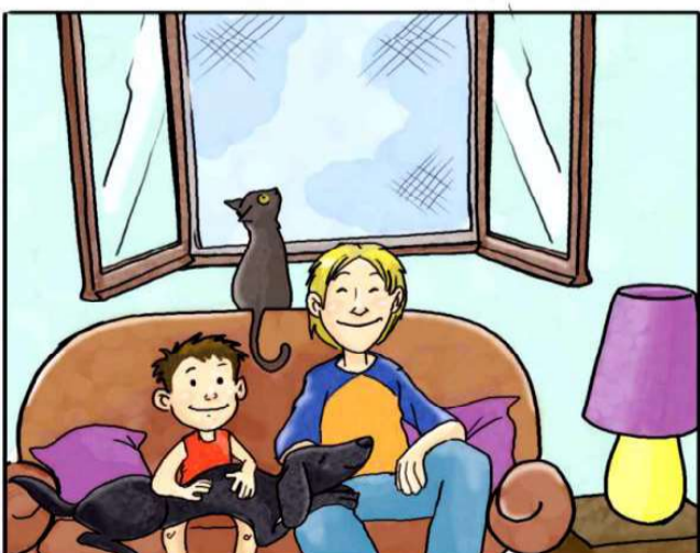
IN CASA USA LE ZANZARIERE ANZICHÉ ZAMPIRONI E FORNELLETTI.