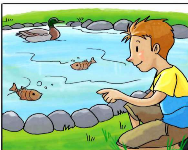
INTRODUCI I PESCI IN VASCHE E FONTANE.